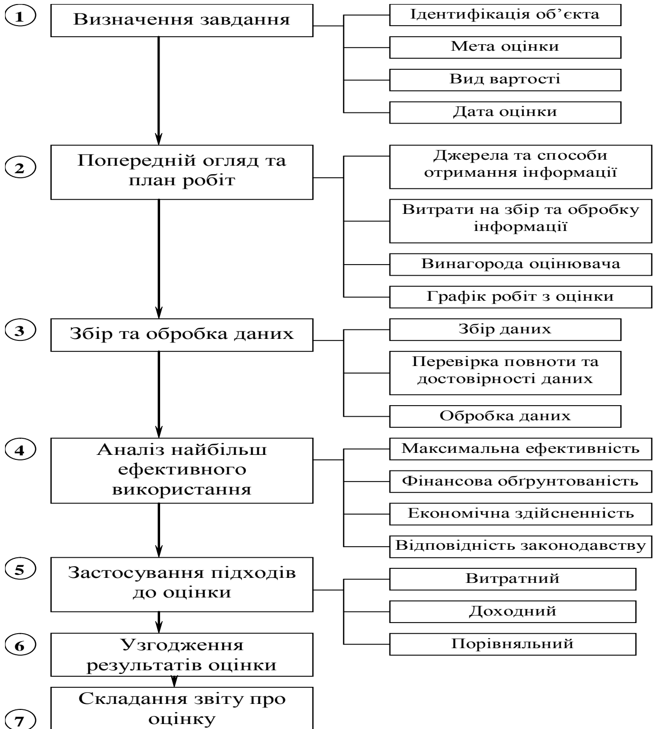
Рис. 3.1. Структура процесу оцінки

Індивідуальна оцінка проводиться у декілька етапів, що об'єднані у поняття «процес оцінки». Процес оцінки майна – послідовність дій, що виконуються оцінювачем під час визначення ним вартості об'єкта. Зазвичай, виділяють сім етапів, представлених на рис. 3.1.