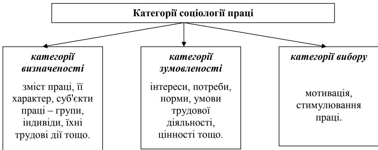
Рис. 11.1. Основні групи категорій соціології праці

Категоріальний апарат соціології праці. У категоріальному апараті соціології праці виокремлюють три групи категорій (див. рис. 11.1). З'ясування сутності основних елементів категоріального апарату соціології праці дає змогу більш предметно розкрити та охарактеризувати систему соціально-трудових відносин , адже у процесі праці люди постійно взаємодіють один з одним: вступають у безпосередні чи опосередковані стосунки, зв'язки, що реалізуються як на суспільному, так і на міжособистісному рівнях.